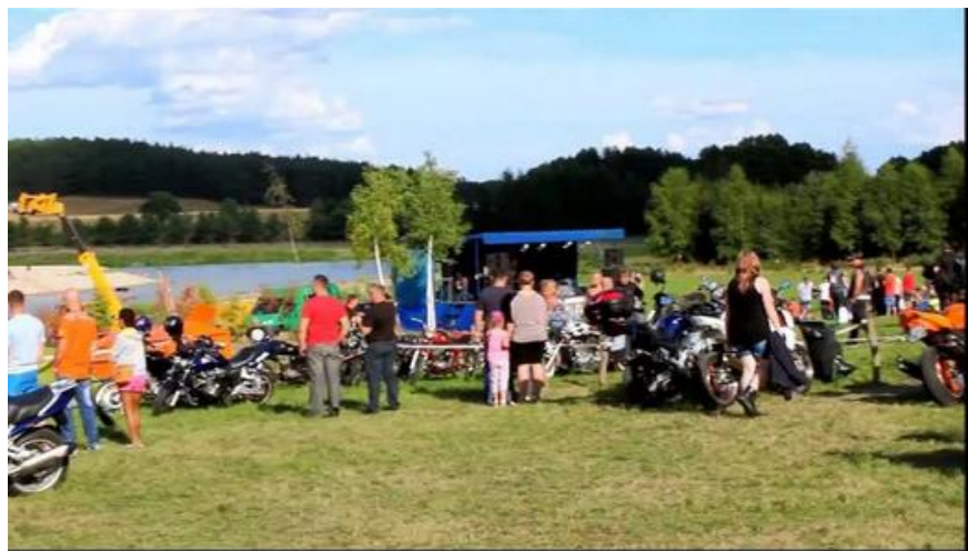
Płonące Party – zjazd motocykli