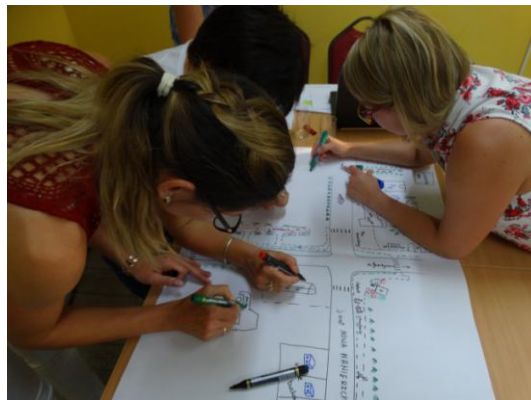
Foto: Aktywni mieszkańcy przy pracy nad wizją wsi