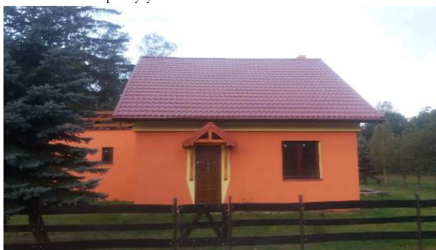
Sala wiejska w Nowym Dworze.