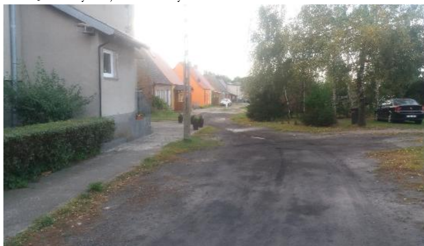
Osiedle domów po byłym PGR